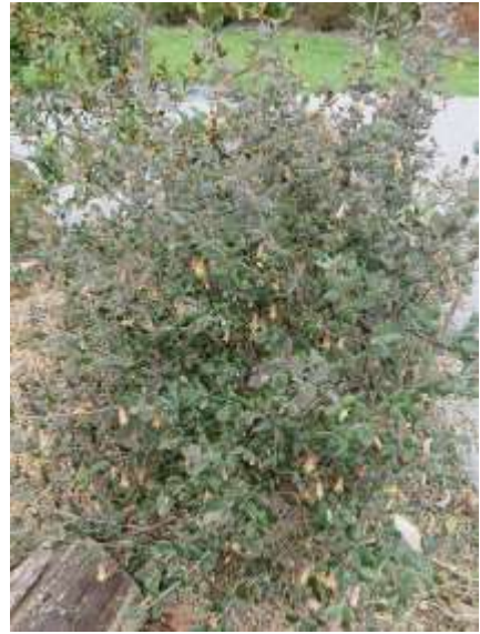
CORREA 'Ring a Ding Ding'