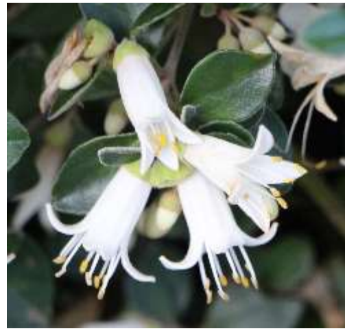
Correa pulchella 'St Andrews white'