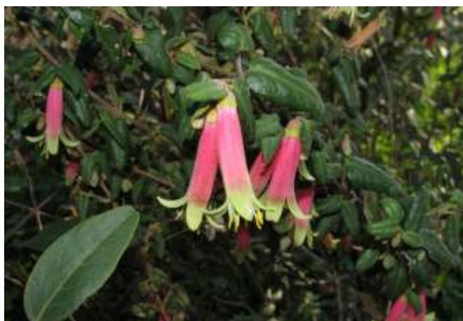
CORREA Reflexa Prostrata