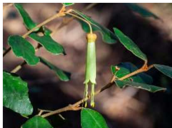
Correa lawrenceana var. latrobeana, fleur verte