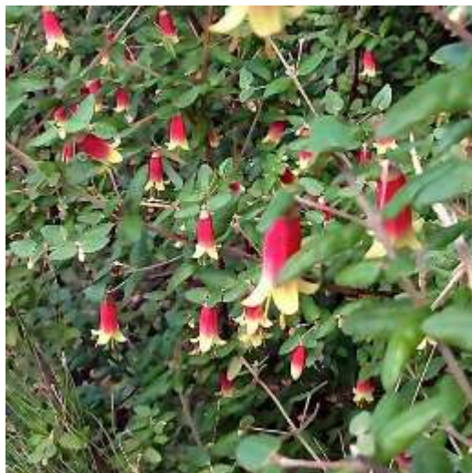
Correa reflexa Grandiflora

► C. reflexa (syn. C. speciosa) : prostré (0,30 m) ou érigé (1,50 m). Fleurs tubulées ou campanulées vertes, rouges, roses ou blanches.