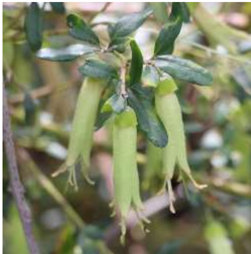
correa glabra 'long john'