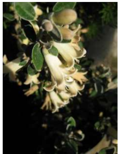
C. 'Ivory Bells' : C. alba x C. backhouseana. 1,50 m x 2 m. Fleurs tubulées blanc ivoire.