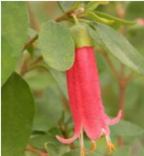
CORREA decumbens 'Dusky Bells'