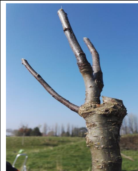
ne pas oublier l'étiquetage Les deux greffes sont réussies en enlevant une et taillant pour élargir le branchage