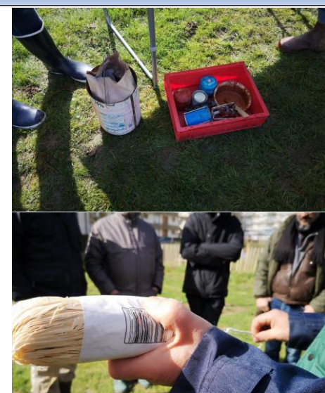
Les outils différents : Sécateur, serpette, greffoir, scie, colle, raphia, pierre à aiguiser, étiquettes...